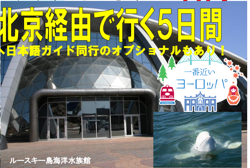
ルースキー島海洋水族館