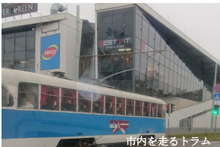
市内を走るトラム

街沿いにダウガヴァ川が流れ中心をノスタルジックなトラムが通るとも落ち着いた雰囲気の場所で街の人たちもとても親切です。きっと研修期間を快適に楽しく過ごすことができます。