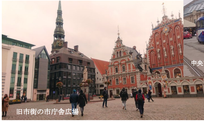
旧市街の市庁舎広場