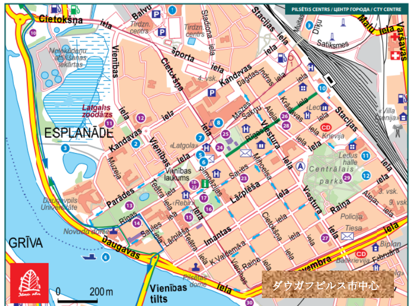
ダウガピルス市中心