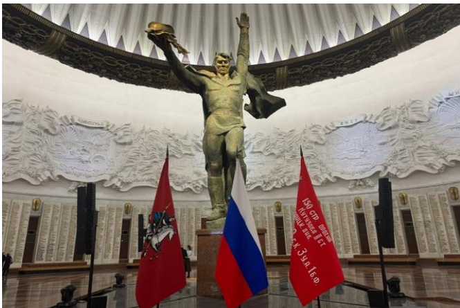
勝利博物館の象徴「栄光の間」

勝利博物館といえば、従来のガイドブックなどでは、大祖国戦争（第二次世界大戦）におけるソ連軍の勝利と栄光を讃える場所として紹介されていますが、現在進行中の特殊軍事作戦に関連した展示品も多数あり、展示内容が日々グレードアップしています。