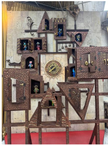
オブラスツォフ人形劇場のからくり時計

もう一か所だけ、モスクワに来たら訪れてみて欲しい場所をご紹介します。オブラスツォフ記念国立アカデミー中央人形劇場は、1931年に創立された歴史ある劇場で、自前で工房や博物館を有し、ロシアの数ある人形劇場の中で最も中心的な役割を果たしています。