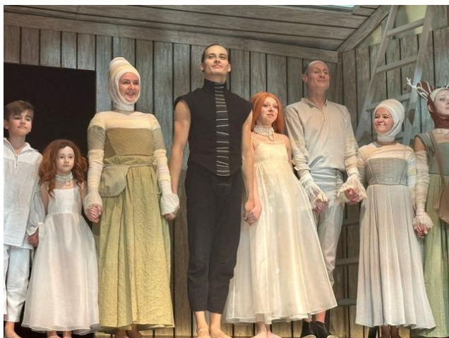
「ファウスト」カーテンコール

内容の面白さに加え、人形の出来栄、人形と人間の共演、連携が素晴らしく、音楽やダンスを多用しており、他の演目と違って一切セリフがありません。しかしセリフがなくても、完全に理解できます。まさにロシアの芸術の良いところ取りです。圧倒的な力に対抗できない無力感に襲われても、最後に一抹の光と希望を見出せる、まさに今のロシアだからこそ生み出されたであろう作品です。