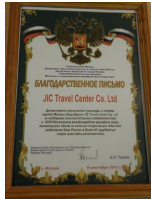
写真はモスクワ国際平和マラソン時のものです。