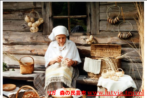
リガ 森の民芸市 www.latvia.travel

ツアーコード 成田 KN20-1307 早割価格 275,000円 通常価格 315,000円 *3月29日(金)までにお申込みなら早割 40,000円引き ☆1人部屋利用追加料金 +28,000円 ☆プレミアムエコノミー座席へのランクアップ+35,000円 (成田⇄モスクワ区間のみ。座席に限りがあります。) *上記の他、成田空港利用料 2,610円、国際観光旅客税 1,000円、燃油サーチャージ 40,000円、(目安 2/1 現在)、海外空港諸税 4,860円、ビザ費用として 9,400円(実費・代行手数料込)が別途必要となります。 注: 燃油サーチャージ、空港諸税は変動することがあります。