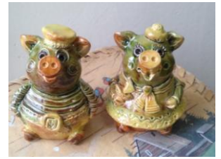
コストロマ 泥人形博物館