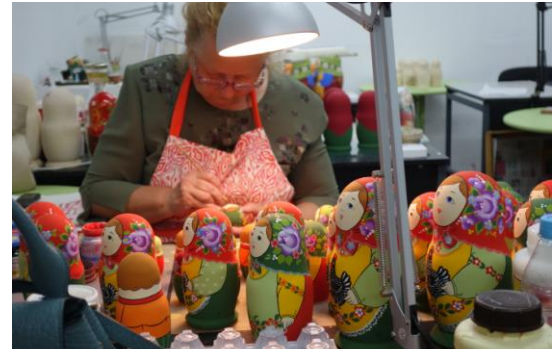
セルゲエフ・ボサードのマトリョーシカ工房の様子

<現地発着プラン> 旅行代金 192,000円 *1名部屋利用追加代金 +28,000円 (早割価格設定無し) *到着・出発時はホテル集合・解散。空港からの送迎手配が必要な方は、別途ご相談ください。