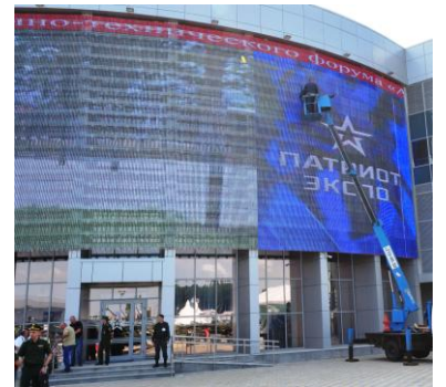
軍事テーマパーク「パトリオット」内の展示