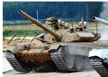
ARMYGAMES2017 戦車バイアスロン・アラビノ会場にて 会場上空を飛行するロシア第5世代戦闘機 T50,戦略爆撃機 Tu22 バックファイア等