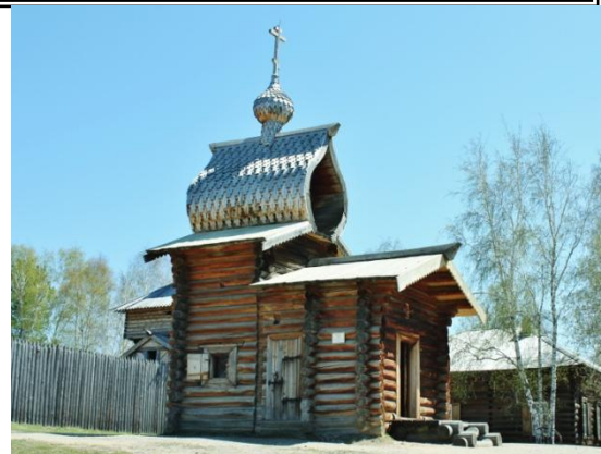
木造建築博物館タリツィ