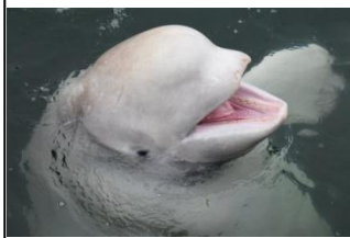
白イルカにも会えるかも