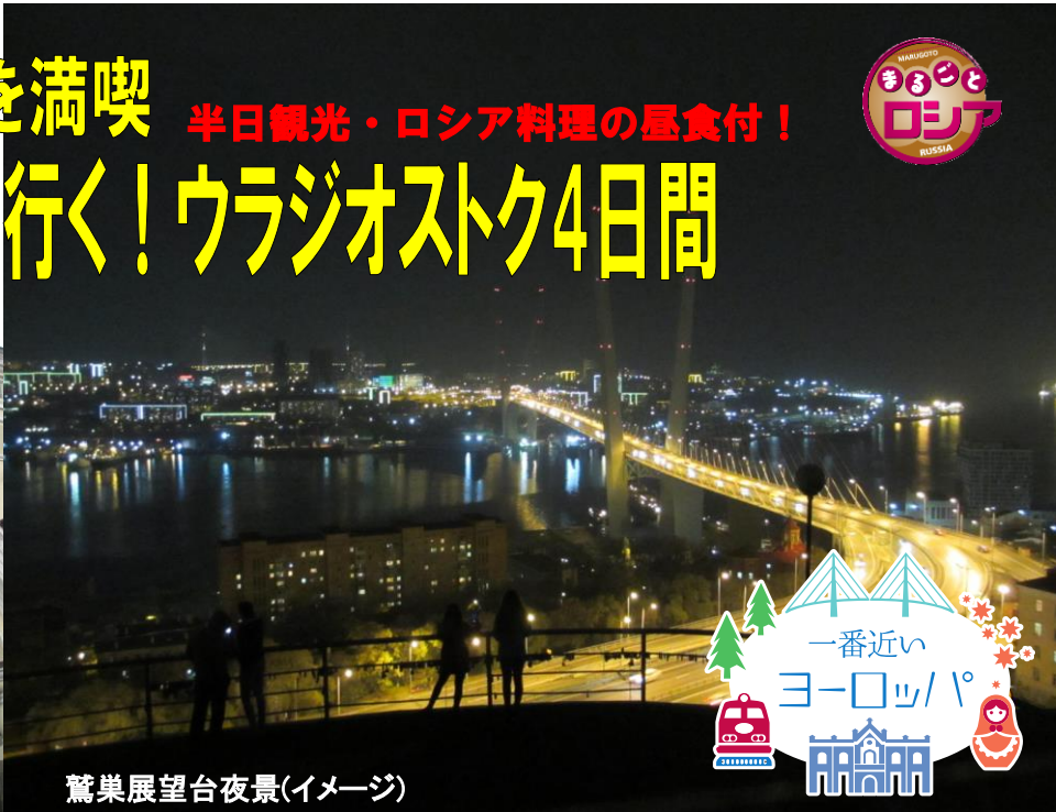
鷲巣展望台夜景(イメージ)