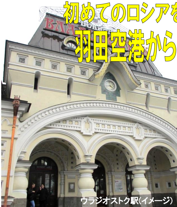
ウラジオストク駅(イメージ)