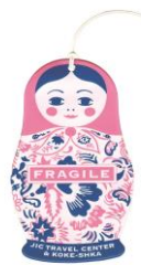
特製マトリョーシカタグ プレゼント！