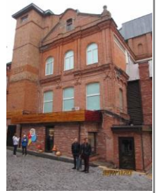
Gum Rengas Street