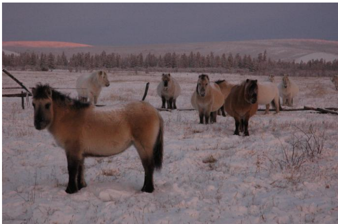
牧場と異様に丸い馬たち

疎林を抜けると、大きく視界が開けました。なだらかな丘陵を遠景に、薄く雪をかぶった地面が漠と広がっています。これが牧場です。車を降りると、数頭の馬が立っているのが目に飛び込んできました。初めて見る、ヤクート馬の姿です。馬たちは皆、何やら口をもぐもぐさせています。雪の