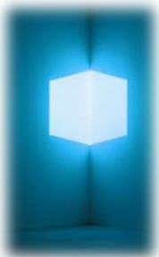
Afrum, Pale Blue

Следующая работа вызывает восторг даже у людей, далёких от искусства. Речь идёт об «Open Field», - одной из работ из серии «ОКНА». Если предыдущая работа даёт посетителю возможность увидеть свет как физическую субстанцию, то «Open Field» приглашает его «войти» в свет и его бесконечность, ощутить его в себе и себя в нём. В завершении вас ждёт знакомство с работой «Open Sky», из серии «НЕБЕСНОЕ ПРОСТРАНСТВО». Вы попадаете в комнату, в потолке которой вырезан правильный квадрат, что позволяет Вам наблюдать за небом. Если в серии «ОКНА» Таррелл использует искусственный свет, то в «НЕБЕСНОМ ПРОСТРАНСТВЕ» - свет естественный, который очень неожиданно вступает в невероятное сплетение со светом искусственным. Дело в том, что стены комнаты, в зависимости от времени суток, освещаются светодиодами (40 видов подсветки), которые подчёркивают постепенно приближающийся закат. Небо постепенно темнеет, меняя цвет с голубого на тёмно-голубой, фиолетовый, и в завершении в чёрный цвет, а стены постепенно окрашиваются в яркий жёлтый цвет, - сначала при помощи естественного солнечного излучения, и затем при помощи светодиодов. В результате квадратное окно в потолке постепенно начинает принимать реальные, физические формы.