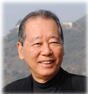
Президент корпорации «Бенессе», Фукутакэ Соитиро

Лагерь открылся в 1989 году, но пока он строился у Соитиро возникла идея преобразовать остров в нечто совершенно уникальное, превратить его в оазис современного искусства.