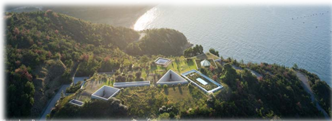
Вид на «Подземный Музей» сверху

Проектированием здания занялся всё тот же Андо Тадао, - с ним, и с авторами «боковых» работ, была полностью согласована концепция нового музея.