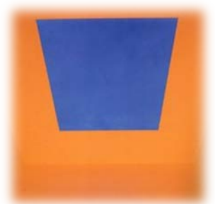
Open Sky (днём и вечером)