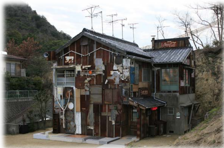
Хаус-проект «ХАЙСЯ» (зубной врач)

Наиболее радостным результатом работы для президента корпорации «Бенессе» стало не то, что на остров устремилась молодёжь, с жадностью прикоснуться к необычному симбиозу природы и искусства, а то, что коренные жители острова – в большинстве своём очень пожилые люди – снова обрели улыбку, интерес к происходящему, надежду, новый смысл жизни.