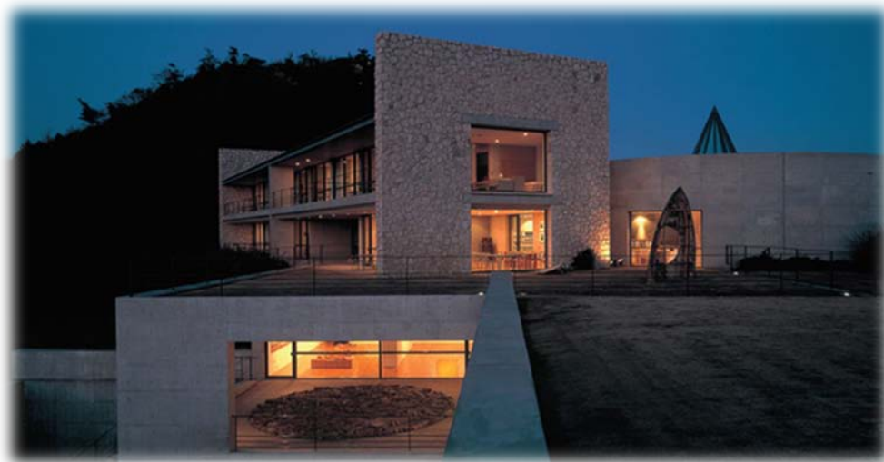
Отель-музей «Бенессе Хаус»