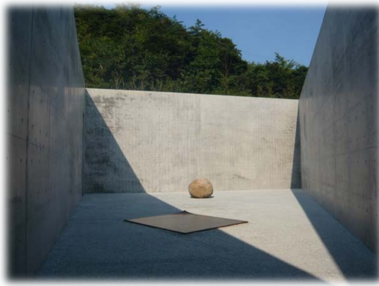
Внутренний сад музея Ли У Фана

В 2010 году открылся «МУЗЕЙ ЛИ У ФАНА», к работам которого Фукутакэ Соитиро уже давно испытывал большой интерес, впервые познакомившись с ними на выставке в Венеции в 2007 году. Произведения Ли У Фана противостоят вещественному миру, они граничат с дзэн-буддистским созерцанием и восприятием окружающего. И если Подземный Музей приобрёл статус мекки европейского современного искусства, Музей Ли У Фана стал квинтэссенцией искусства дальневосточного.