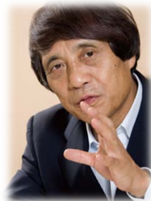
Архитектор Андо Тадао