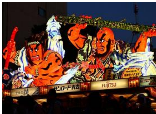
Фестиваль «НЭБУТА» в Аомори

Именно такой подход к положению дел получил наибольшую поддержку у жителей страны, поэтому летние фестивали будут проводиться как обычно во всех регионах, даже в пострадавших от землетрясения и цунами.