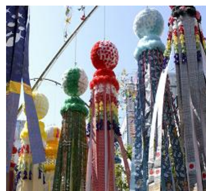
«ТАНАБАТА» в Сэндай