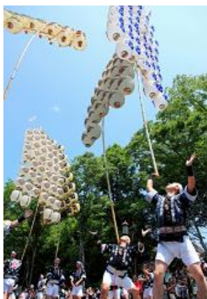
«КАНТО» в Акита