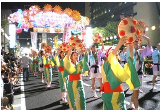
Фестиваль «цветочных шляп» в Ямагата

Традиционные танцы города Мориока (префектура Иватэ) были объединены в одно большое мероприятие еще в эпоху Эдо (17-19 века), а с 1978 года фестиваль был признан полноценным событием, на которое съезжалось большое количество туристов со всей страны и из-за границы. В фестивале принимают участие самые различные организации – от кружков самодеятельности каждого отдельно взятого района города, до групп по интересам на рабочем месте или в школах. В течение 4-х дней на улицах города под звуки барабанов и дудок демонстрируют свое умение порядка 240 организаций, - а это более 20 тысяч человек. В фестивале задействовано самое большое количество барабанов в мире – 12 тысяч, что помогло фестивалю войти в книгу рекордов Гинесса. Шествие танцоров, одетых в одинаковые традиционные костюмы, вызывает неописуемый восторг у туристов.