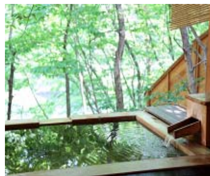
Ванна на открытом воздухе