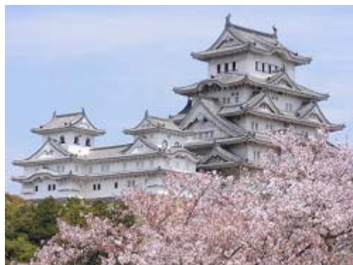
Храм Химэдзи во время цветения сакуры