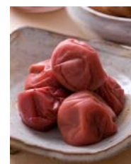
Солёные сливы «умэбоси»

Слива начинает цвести на 1-2 месяца раньше сакуры. Обычно расцветает слива в феврале-марте, однако ранние сорта распускаются уже в середине января. У вишни по одному цветку на каждом сучке, поэтому цветение выглядит гораздо скромнее чем цветение сакуры или персика. Цветет и опадает слива за гораздо более длительный срок, чем сакура, тем не менее, японцам цветение сливы напоминает о том, что весна не за горами.