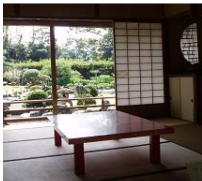
Традиционная японская комната