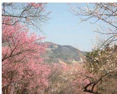
Сливовая роща красные и белые сливы